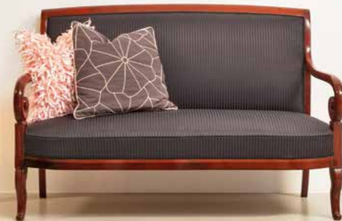
°75 Kleines Sofa Mahagoni massiv Norddeutsch um 1840 B 138 cm, T 60 cm, H 87 cm Sitzhöhe: 44 cm 3.800.- Euro