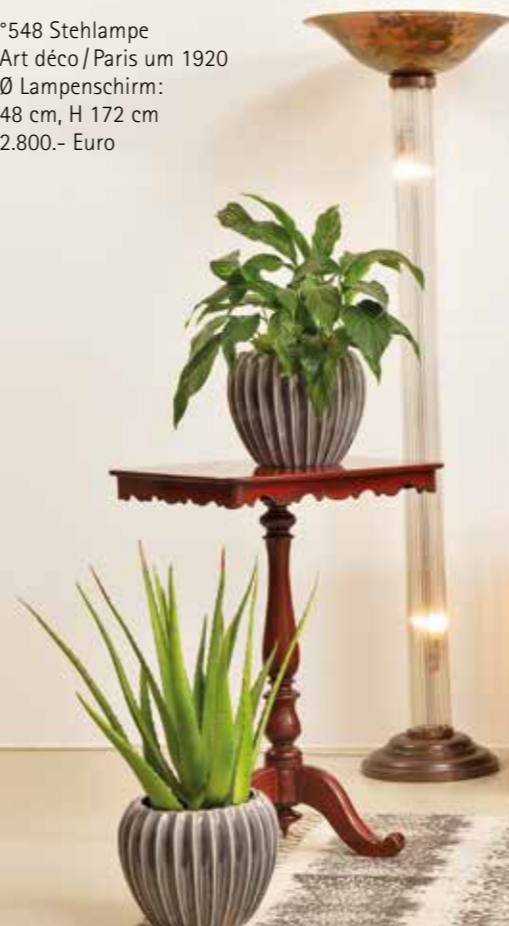
°823 Kleines Beistelltischchen Mahagoni massiv England um 1840 L 50 cm, B 42 cm, H 76 cm 950.- Euro