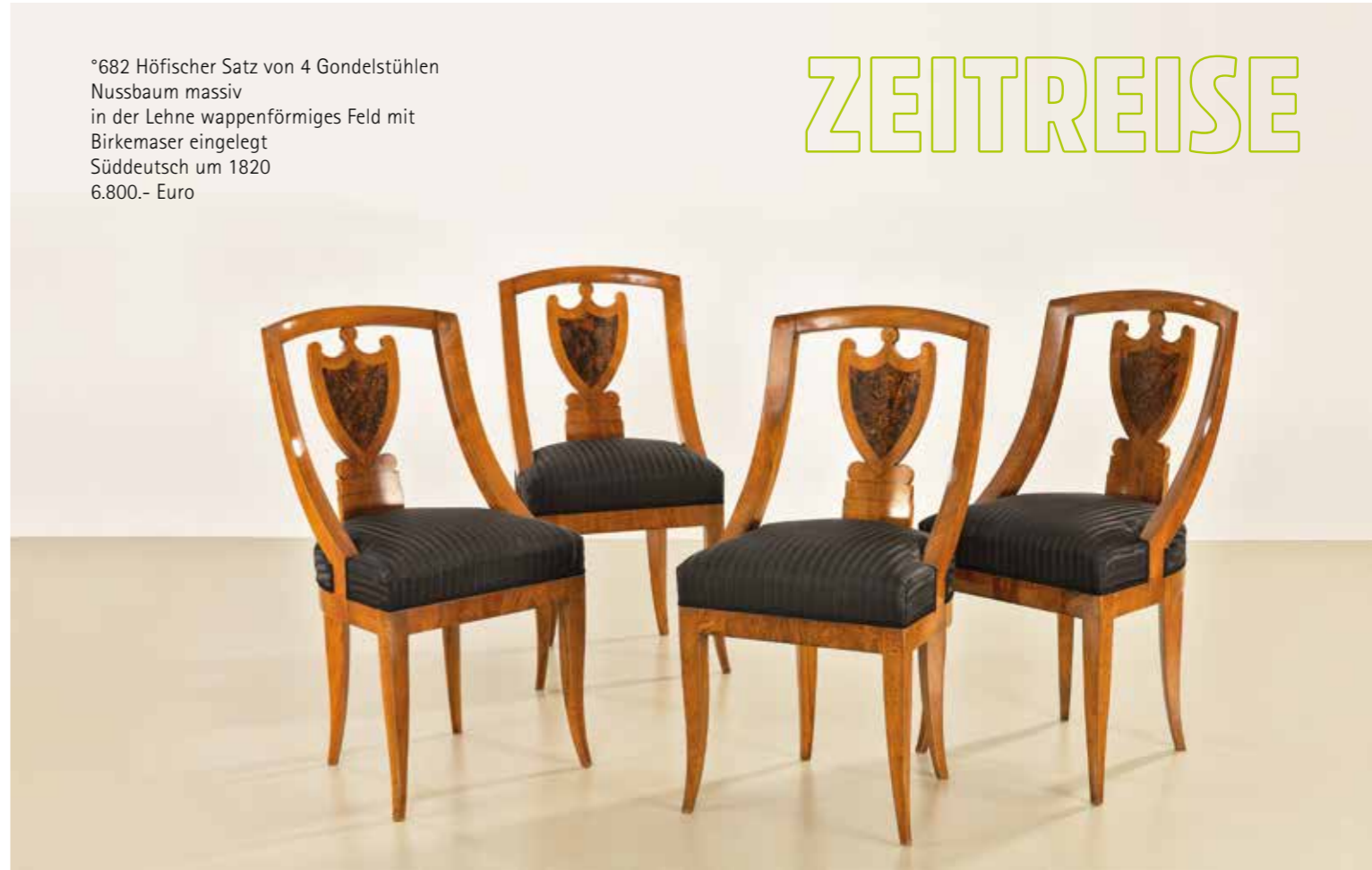
°682 Höfischer Satz von 4 Gondelstühlen Nussbaum massiv in der Lehne wappenförmiges Feld mit Birkemaser eingelegt Süddeutsch um 1820 6.800.- Euro