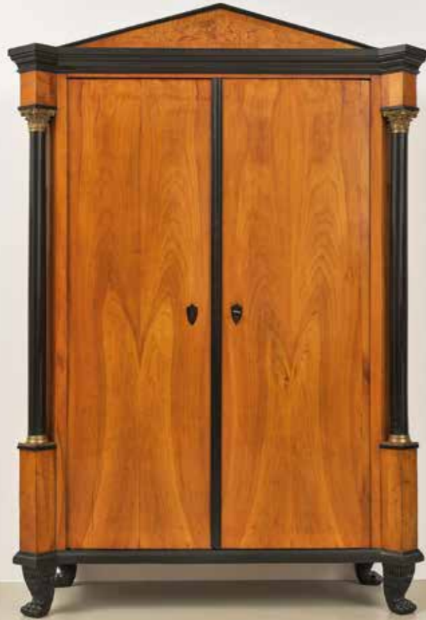
°143 Höfischer Schrank Kirschbaum furniert München um 1820 B 154 cm, T 61 cm, H 223 cm 24.500.- Euro