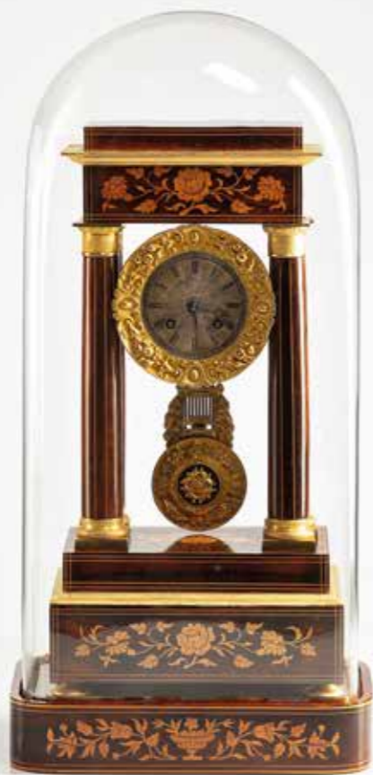
°82 Kaminuhr Palisanderholz im originalen Glassturz Frankreich um 1830 B 27,5 cm, T 16,5 cm, H 58 cm 2.800.- Euro