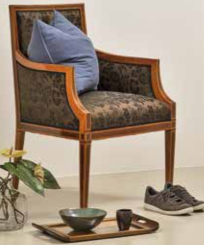
°111 Armlehnsessel Zitronenholz/Mahagoni Südwestdeutsch um 1880 B 62 cm, T 56 cm, H 93 cm Sitzhöhe: 48 cm 3.800.- Euro