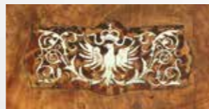
°10 Barockkommode Nussbaum furniert Braunschweig um 1780 B 112 cm, T 62 cm, H 79 cm 6.800.- Euro