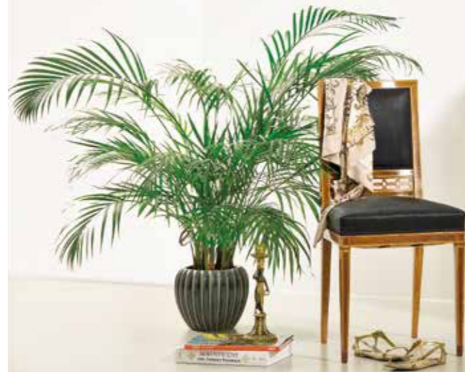
°113 Stuhl Zitronenholz/Mahagoni Südwestdeutsch um 1880 950.- Euro