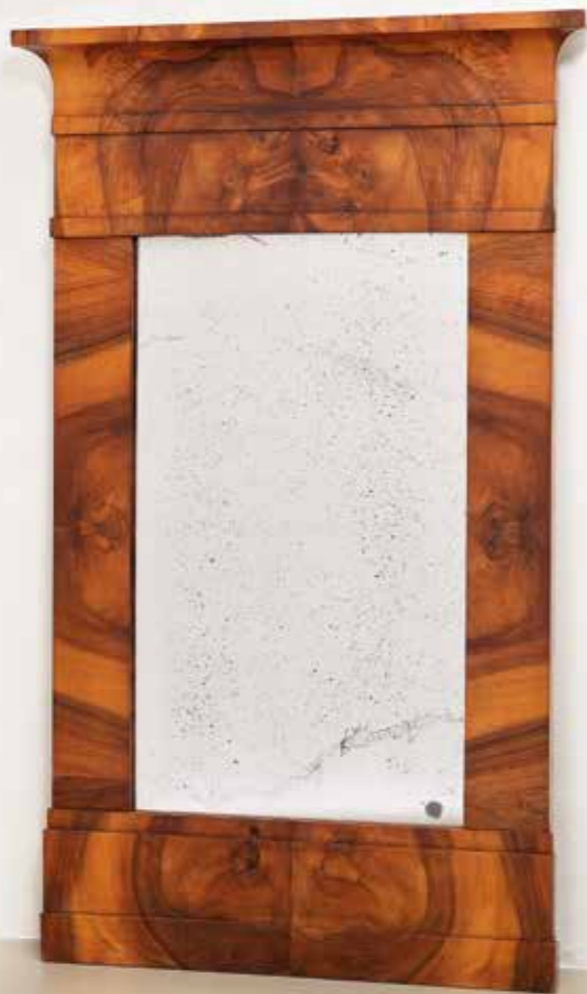
°401 Spiegel Nussbaum furniert Süddeutsch um 1820 B 68 cm, T 6 cm, H 108 cm 1.250.- Euro