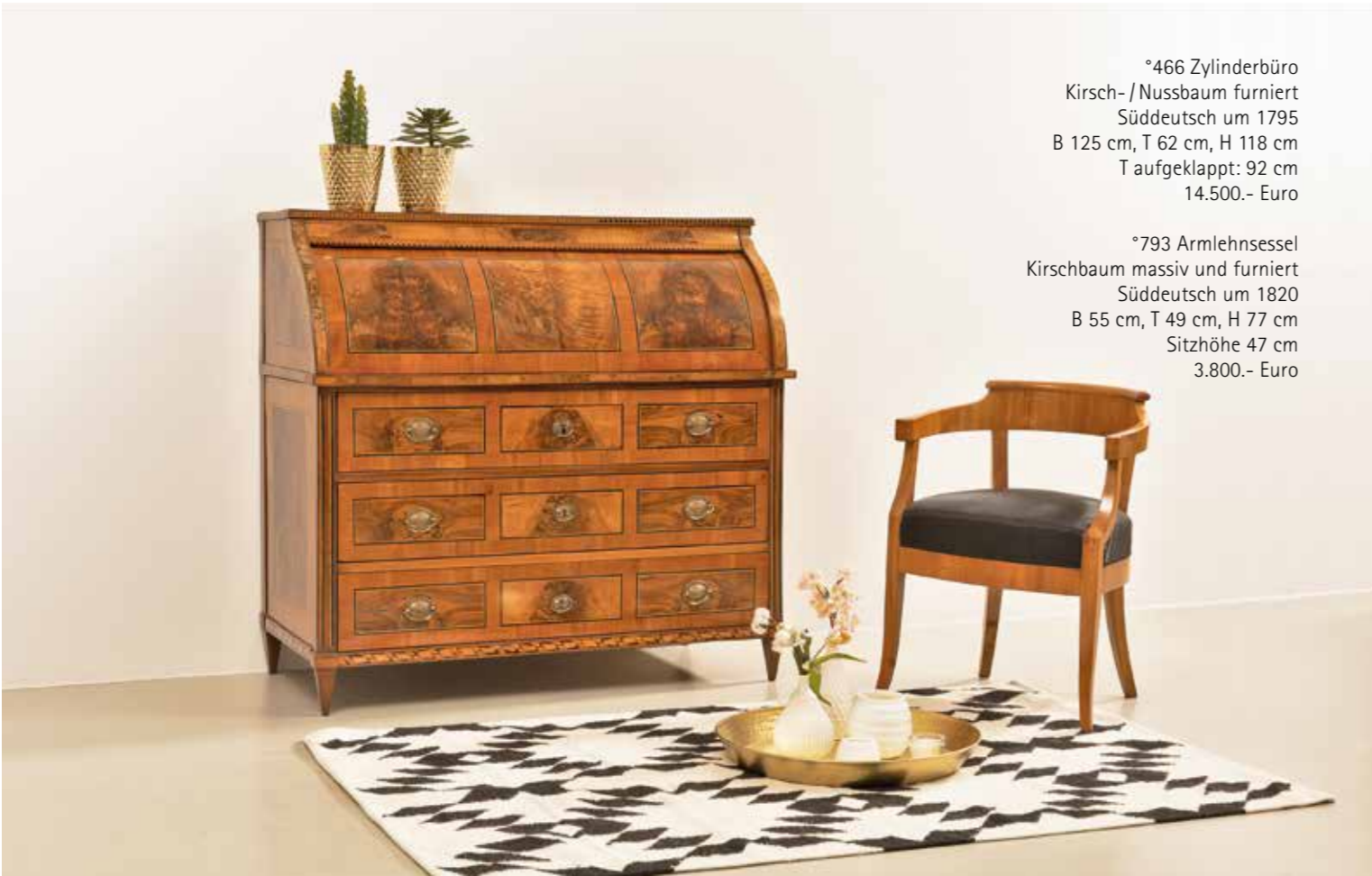
°466 Zylinderbüro Kirsch- / Nussbaum furniert Süddeutsch um 1795 B 125 cm, T 62 cm, H 118 cm T aufgeklappt: 92 cm 14.500.- Euro