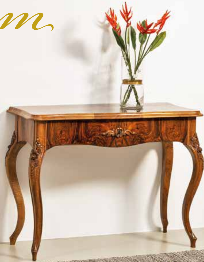
°193 Konsole Nussbaum Maserholz Süddeutsch um 1860 B 108 cm, T 45 cm, H 79 cm 1.850.- Euro