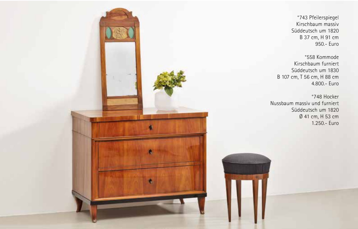
°743 Pfeilerspiegel Kirschbaum massiv Süddeutsch um 1820 B 37 cm, H 91 cm 950.- Euro