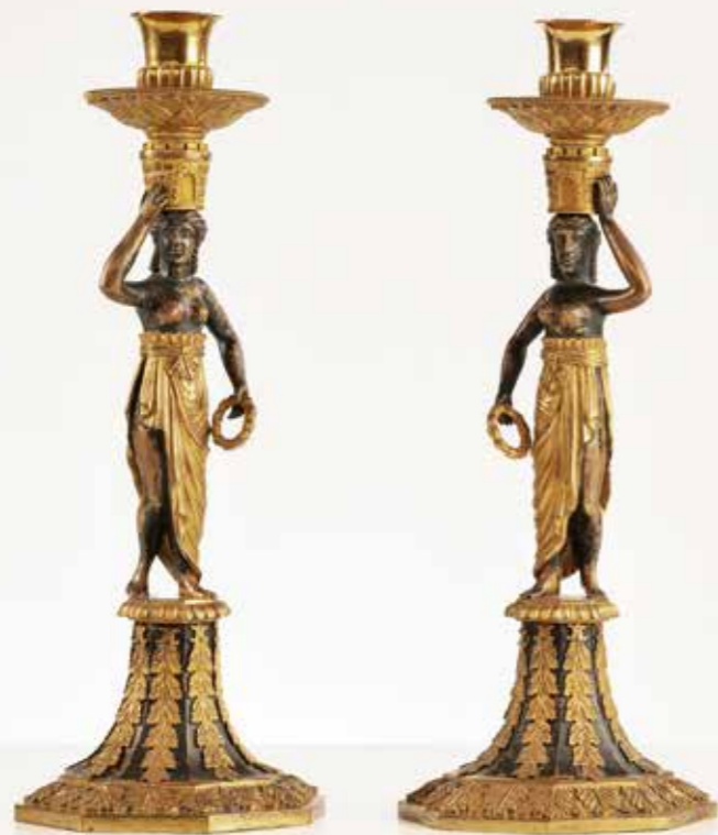
°43 Paar Kerzenleuchter Bronze / feuervergoldet Wien um 1820 Ø 11,5 cm, H 31 cm 4.800.- Euro