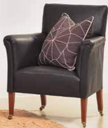
°408 Ledersessel mit Rollen Deutsch um 1920 B 69 cm, T 67 cm, H 84 cm Sitzhöhe: 39 cm 1.850.- Euro