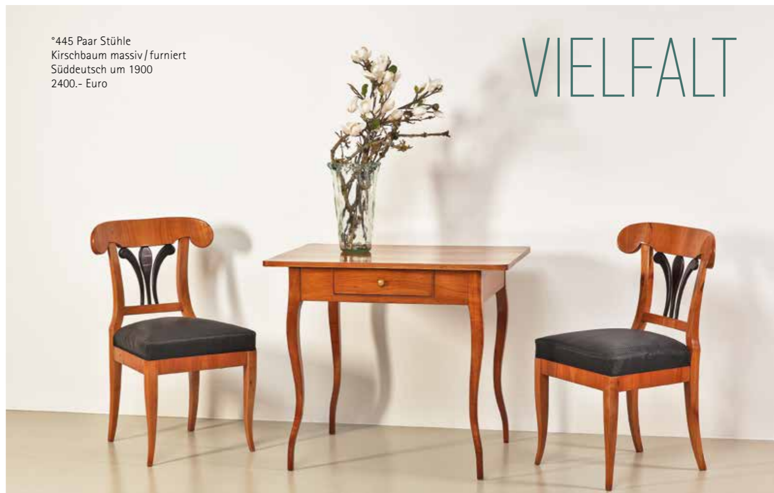
°445 Paar Stühle Kirschbaum massiv/furniert Süddeutsch um 1900 2400.- Euro