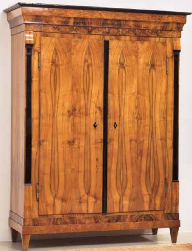
°56 Schrank Nussbaum / Maserholz furniert Süddeutsch um 1820 B 143 cm, T 57 cm, H 191 cm 8.500.- Euro