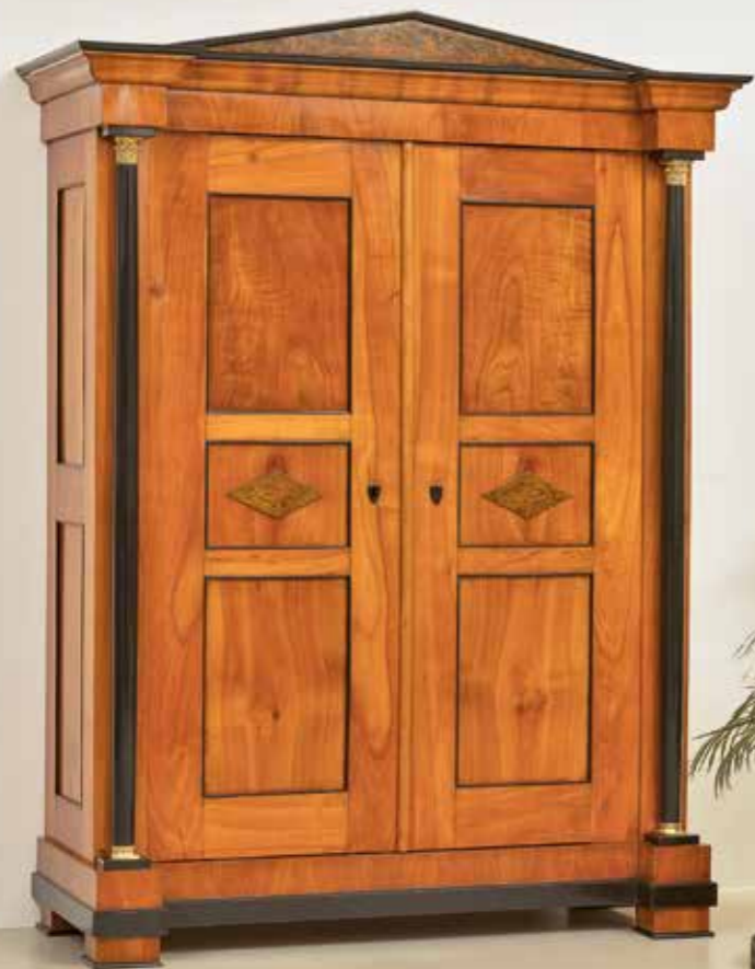
°270 Schrank Kirschbaum massiv und furniert Süddeutsch um 1820 B 150 cm, T 61 cm, H 201 cm 9.500.- Euro