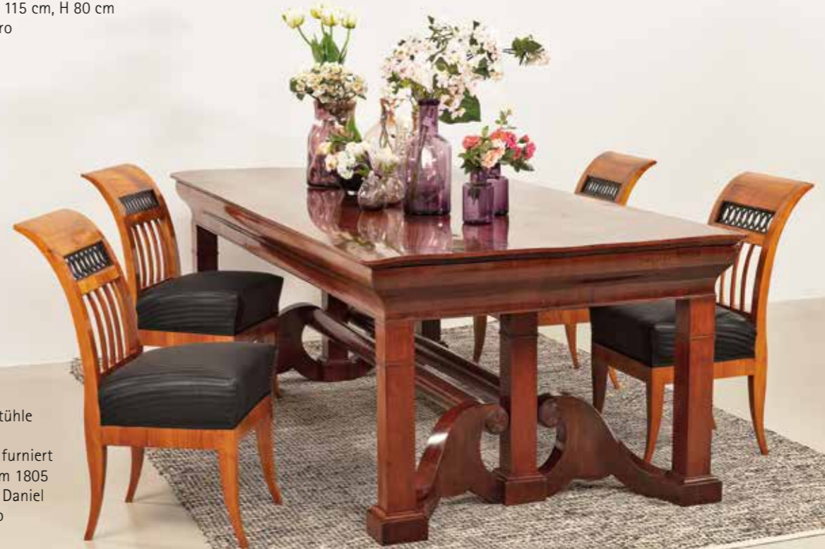
°176 Satz Stühle Kirschbaum massiv und furniert München um 1805 Hofkistlerei Daniel 5.800.- Euro