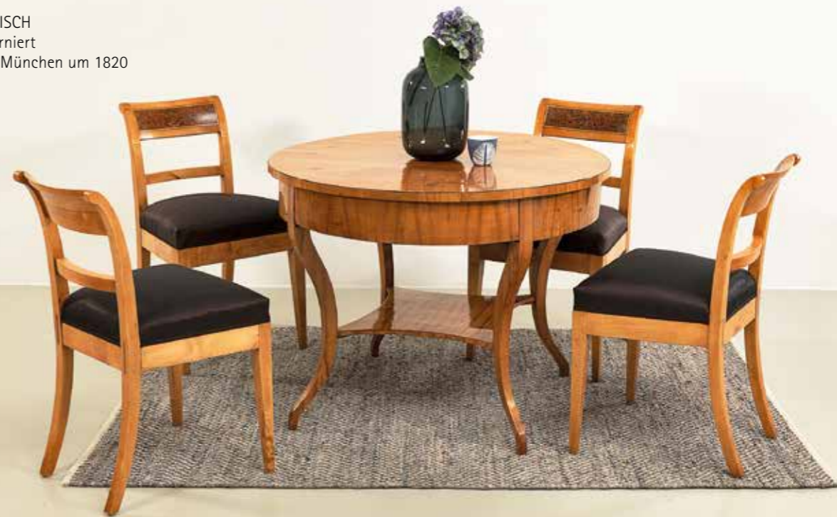
°051 SALONTISCH Mahagoni furniert Süddeutsch / München um 1820 4800.- Euro