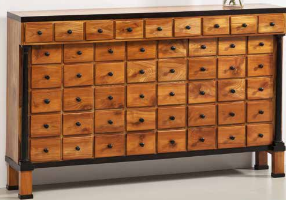
°31 Apothekenschrank Kirschbaum massiv München um 1820 B 175 cm, T 34 cm, H 108 cm 14.500.- Euro