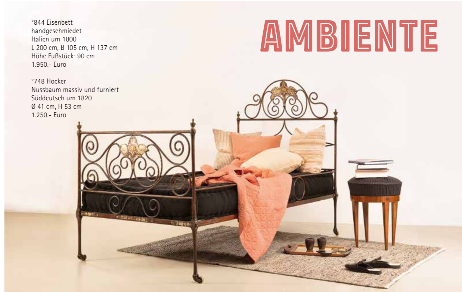
°844 Eisenbett handgeschmiedet Italien um 1800 L 200 cm, B 105 cm, H 137 cm Höhe Fußstück: 90 cm 1.950.- Euro